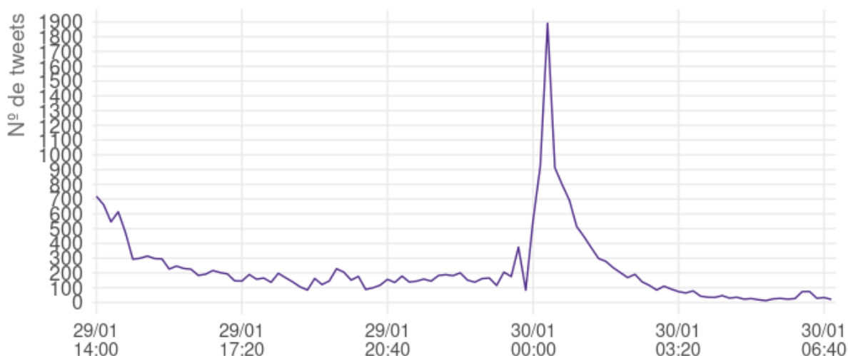
Evolução do compartilhamento dos tweets que mencionam a hashtag #FicaGabriel

Essa hashtag mobilizou um volume relevante de compartilhamentos em um curto espaço de tempo. Verificamos que 37.7% dos registros compreendem tweets nativos, enquanto 62.3% são RTs. Além disso, identificamos que 7277 usuários compartilharam a hashtag pelo menos uma vez.